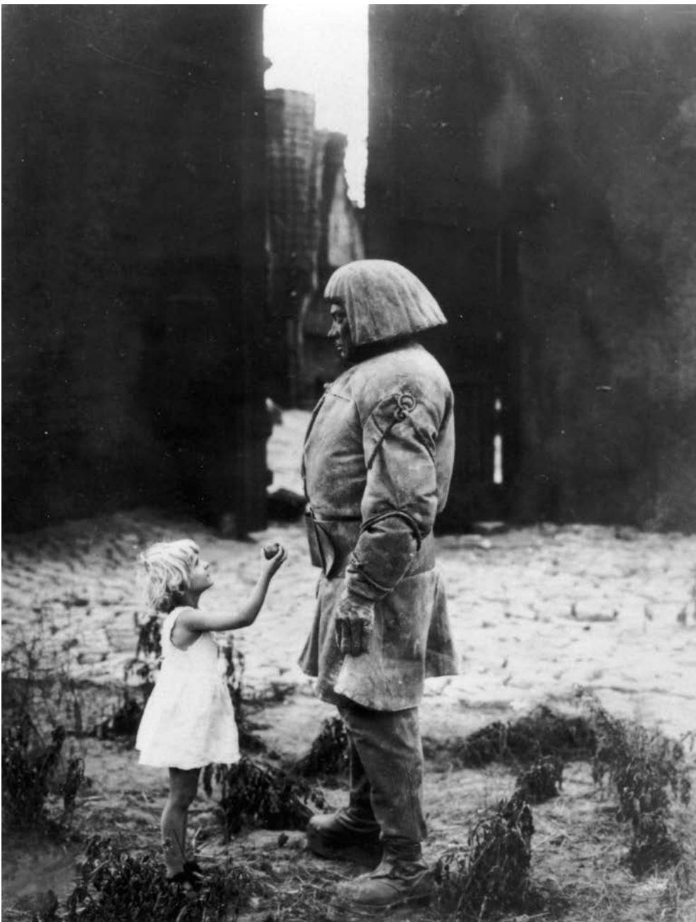
Paul Wegener, Le Golem, comment il vint au monde , 1920, Deutsche Kinemathek.