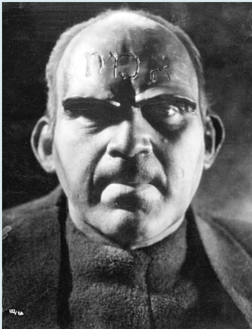
Julien Duvivier, Le Golem, France, 1936

Né en 1896 à Lille dans une famille très catholique, Julien Duvivier s'oriente vers le cinéma en 1919, endossant les casquettes de réalisateur et scénariste. Excellent technicien, homme cultivé aux goûts éclectiques, le réalisateur de Pépé le Moko (1937), La Belle équipe (1936) ou encore Voici le temps des assassins (1956) s'essaie à tous les genres et réalise une soixantaine de films, dont un grand nombre sont des adaptations littéraires.