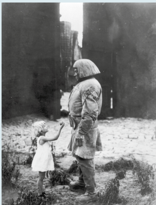
Paul Wegener, Le Golem, comme il vint au monde, 1920, Deutsche Kinemathek, Berlin