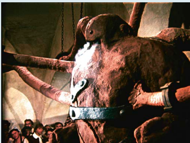
Martin Frič, Le Boulanger de l'empereur – L'Empereur du boulanger, Tchécoslovaquie, 1951

Le réalisateur et scénariste tchèque Martin Frič (1902-1968) est désigné en 1951 pour remplacer Jiří Krejčík aux commandes du diptyque Le Boulanger de l'empereur – L'Empereur du boulanger . Librement adapté d'une pièce de Jan Werich (1905-1980) et Jiří Voskovec (1905-1981), le film en deux parties est le résultat d'un projet de longue haleine qui joue sur les nombreuses variations de la cinématographie européenne du Golem. Dramaturges et acteurs de théâtre, Werich et Voskovec proposent dans les années trente au réalisateur français Julien Duvivier d'adapter leur pièce portant sur la légende juive du Golem. Fasciné par le film de Wegener Der Golem, wie er in die Welt kam (1920), Werich tient lui aussi à revisiter le mythe juif. Duvivier accepte l'adaptation mais décide après réflexion de supprimer les rôles que les deux auteurs devaient jouer dans le film, sonnante ainsi la fin de la collaboration et donnant naissance à une version personnelle de la pièce, soit le film Le Golem (1936). Une vingtaine d'années plus tard Jan Werich remanie la pièce originale et engage le metteur en scène Jiří Krejčík pour l'adapter au cinéma, avec lequel il est bientôt en désaccord. Werich, qui joue aussi bien le boulanger que l'empereur dans le film, choisit finalement Martin Frič pour mettre en image sa conception du Golem.