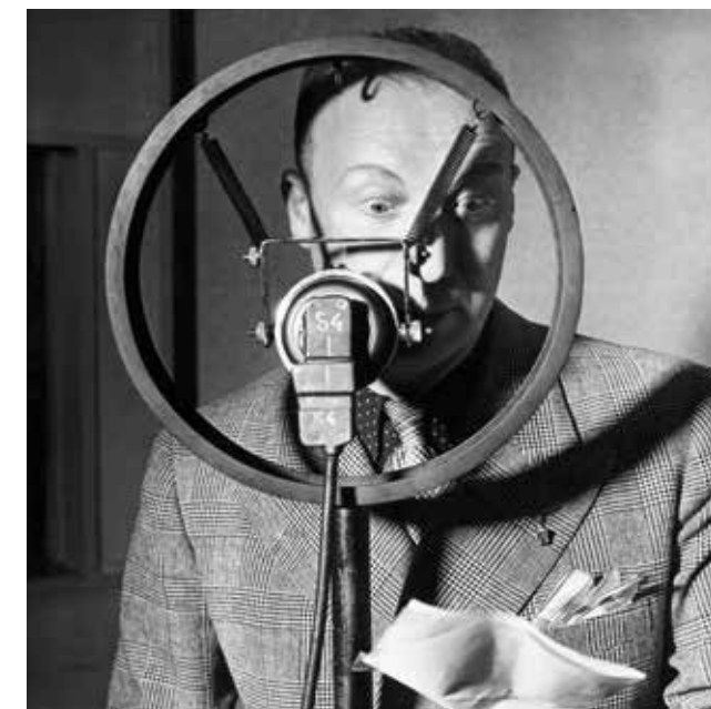
Brassai, Pierre Dac devant un micro, 1935, collection particulière - Brassai © Estate Brassai - RMN-Grand Palais