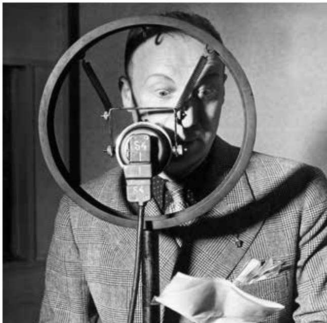
Brassat, Pierre Dac devant un micro, 1935, collection particulière - Brassat © Estate Brassat - RMN-Grand Palais

► Visite guidée de l'exposition À partir de la 3 e (durée: 1h30)