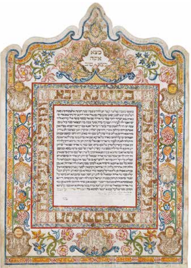
Contrat de mariage, Italie, 1776, écriture manuscrite à l'encre sur parchemin, enluminure. Dépôt de la Bibliothèque de l'Alliance Israélite Universelle

CM1 et CM2: séance de 2h 6 e et 5 e : séance de 2h30