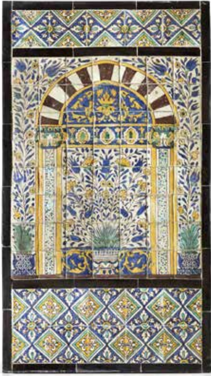
Panneau de revêtement mural, poterie Chemla (vers 1880-1966), Tunis, vers 1920. Céramique polychrome