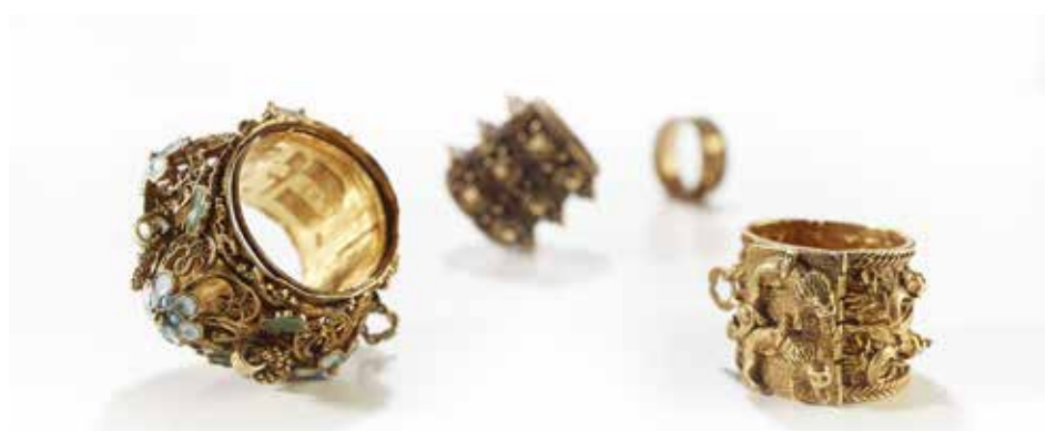
Bagues de mariage, Allemagne et Italie, XVI e -XVII e siècles, or, émail, perles. Dépôt du musée de Cluny - musée national du Moyen Âge, collection Strauss.

Consultez notre programme et organisez votre événement (mahj.org)